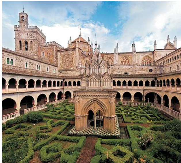
Kreuzgang des Klosters Nuestra Señora de Guadalupe (UNESCO Weltkulturerbe)

dieser Folder wurde CO 2 - neutral hergestellt