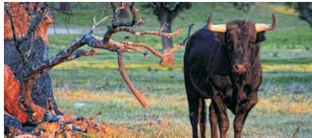
Szene in einem Korkeichenhain der Extremadura. So zu erleben bei einem Besuch einer Stierzucht-Finca in der Nähe von Cáceres.

Erste Etappe ist Toledo. Nirgendwo sonst in Zentralspanien ist das maurische Erbe Spaniens so lebendig und greifbar wie hier. Nächste Etappe ist Trujillo bzw. Guadalupe, dessen berühmtes königliches Kloster sich vor einer imposanten Bergkulisse in wildromantischer Landschaft erhebt. Von Trujillo aus stehen weitere Ziele in der Extremadura auf dem Programm, wie z.B. das UNESCO-Welterbe Cáceres, in der zusammen mit Trujillo, die Zeit der Eroberung der Neuen Welt lebendig wird. Nach Salamanca, ins Grenzland zu Portugal führt das nächste Etappenziel und von dort auch nach Ávila (Weltkulturerbe), der höchstgelegenen Provinzhauptstadt Spaniens, die sich ihr mittelalterliches Aussehen bis heute bewahren konnte. Eine echte Zeitreise! Auf dem Weg zur letzten Station Madrid besuchen wir die imposante Schlossanlage El Escorial (Weltkulturerbe) vor den Toren der Hauptstadt. Unser Quartier inmitten des historischen Zentrums, erlaubt gerade hier am Leben der Stadt teilzuhaben, und die vielen Monumente einfach zu erreichen. Bei einem Ausflug an die Peripherie der Metropole erleben wir zudem das nicht weniger beeindruckende Madrid der Postmoderne.