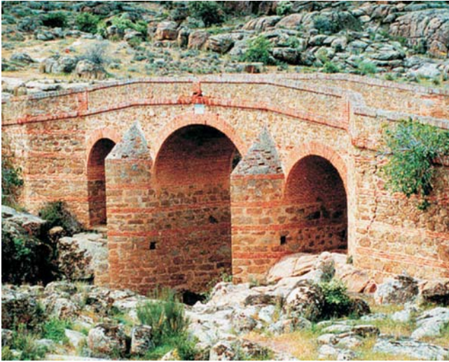
Alte Brücke über dem Rio Pusa in der La Jara