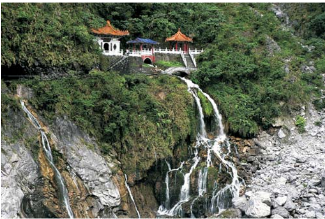
Aussichtspunkt in der Taroko-Schlucht