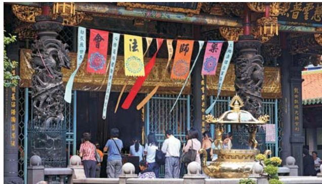
Gebet im Longshan-Tempel (Taipei)

Nach seiner enormen wirtschaftlichen Entwicklung, gehört Taiwan heute zu den Ländern mit dem höchsten Wohlstand. Der hohe Lebensstandard spiegelt sich in zahlreichen Bereichen wider: angefangen bei der hervorragenden Infrastruktur, über das Gesundheitswesen, bis hin zur vorbildlichen Bildungspolitik. Der unglaubliche Reichtum an chinesischen Kulturgütern und die teils atemberaubenden Landschaften dieser großen Insel lohnen auf jeden Fall die weite Anreise, die wir mit China Airlines im Direktflug ansteuern. Von den Portugiesen zu recht Ilha Formosa (die schöne Insel) genannt, lockt Taiwan bis heute mit einer einzigartigen subtropischen Vegetation. Der größte Teil der Insel wird durch Bergmassive mit fast 4000 m Höhe geprägt.