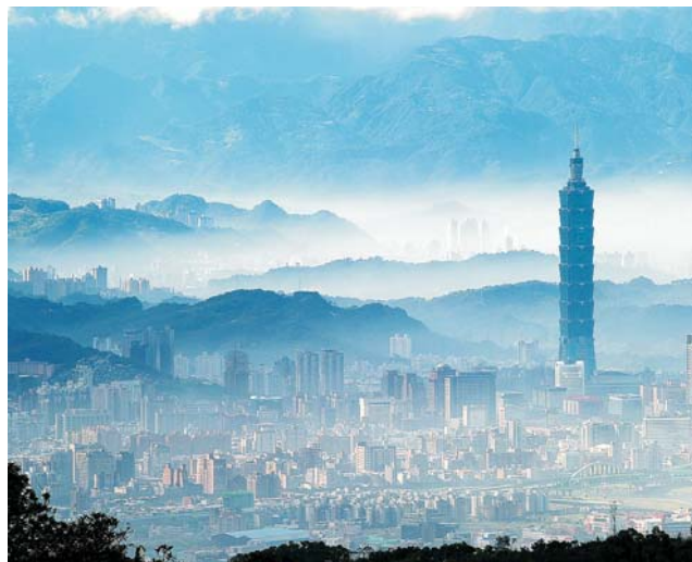
Taipei im Morgendunst mit dem 101 Tower, einst höchstes Gebäude der Welt

dieser Folder wurde CO 2 - neutral hergestellt